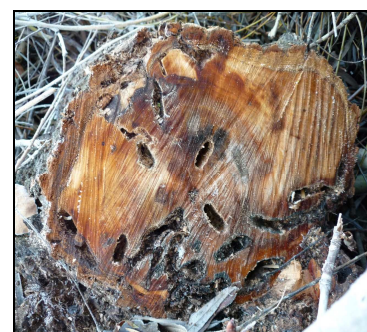
Sezione di un tronco con profonde gallerie scavate dalle larve del Tarlo asiatico del fusto