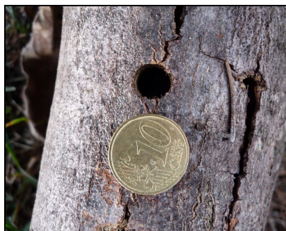
Foro di uscita circolare (1 - 1,5 cm di diametro) dell'insetto adulto

Nicchia di ovideposizione: è una piccola abrasione circolare sulla corteccia del fusto e dei rami; appena realizzata (nel periodo estivo) è facilmente visibile mentre poi (nel periodo autunnale-invernale) si presenta annerita e parzialmente cicatrizzata.