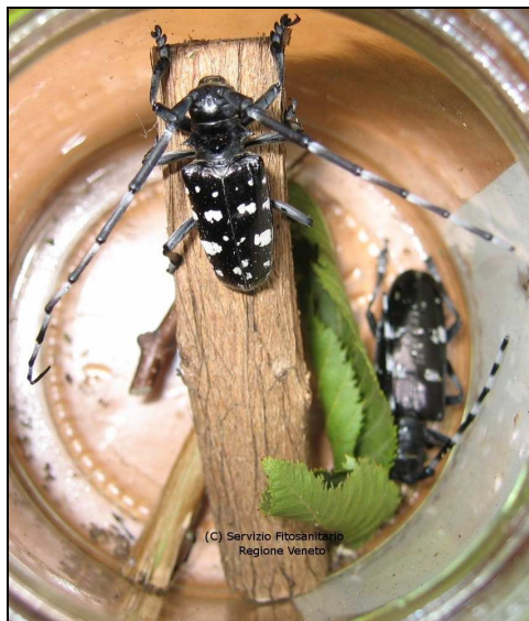
Tarlo asiatico del fusto ( Anoplophora glabripennis )

Come adulto è presente nel periodo da maggio a ottobre.