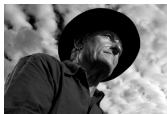
Terra_01 Alfonso Papa Fotografia digitale - 2009