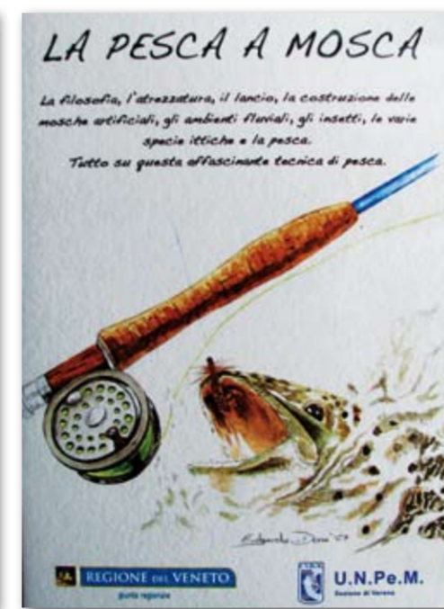
Copertina DVD "La Pesca a mosca"