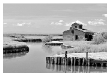
Po e suo delta