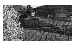
Pedemontana e colli