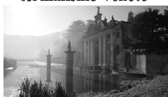
Terme Euganee e termalismo veneto