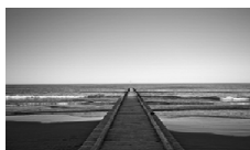
Mare e spiagge