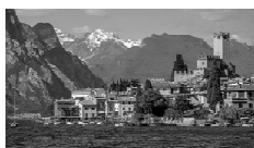
Lago di Garda