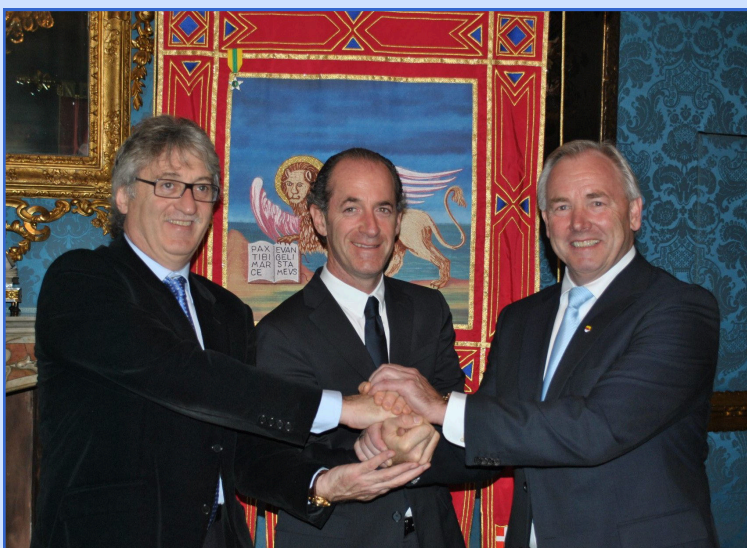
Il Presidente Zaia con il Presidente Tondo del FVG e il Presidente Dörfler della Carinzia.

Accanto al Presidente Zaia, a Klagenfurt