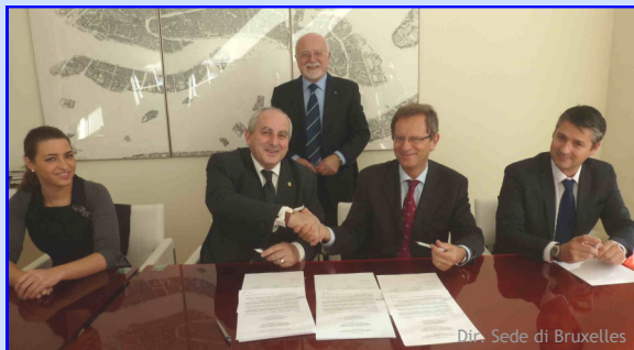
Dire. Sede di Bruxelles

Il consorzio Filiera Legno Veneto è nato da poco e si propone come punto di riferimento territoriale per le Piccole e medie imprese venete del settore, con un interesse speciale per i temi della sostenibilità e dell'innovazione tecnologica e in particolare per la green building economy. Con l'ingresso di Filiera Legno Veneto, diventano 16 le imprese e gli enti domiciliati presso Casa Veneto a Bruxelles che costituiscono la rete "Veneto Region Network in Europe".