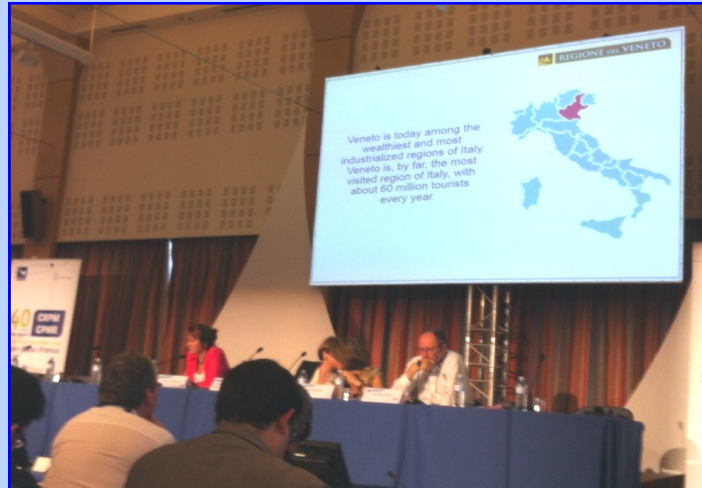
Dir. Sede Bruxelles

le regioni che la compongono organizzano regolarmente seminari tematici su temi di interesse. Inoltre, to-