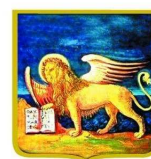
REGIONE DEL VENETO

Fondo europeo agricolo per lo sviluppo rurale: l'Europa investe nelle zone rurali