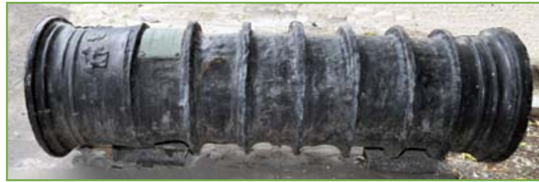
▲ 'Tromba' di bombarda veneziana di ferro battuto del XV secolo. Queste artiglierie, rarissime e di difficile attribuzione, funzionavano a retrocarica: nella 'tromba' si posizionava una palla di pietra mentre nel 'mascolo' (o cannone) si introduceva la polvere nera della carica di lancio

Dall'inizio del Cinquecento le artiglierie di bronzo dominarono la scena e questa predilezione durò fino alla fine del secolo successivo, quando la necessità di armare i vascelli – fino alla guerra di Candia la Serenissima uti-