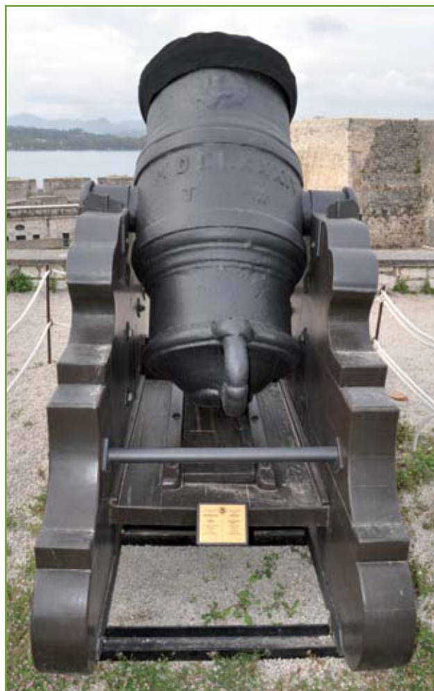
▲ Uno dei due mortai da 1.000 libbre fusi da Thomas Western. Recano in rilievo il Leone di San Marco in moleca , la data 1684 e le iniziali del fonditore; la bocca risulta protetta da una cuffia di tessuto