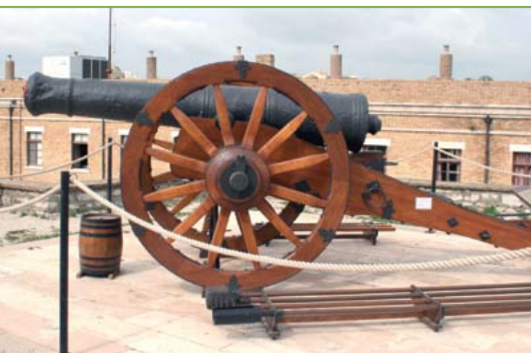
▲ Il cannone del Camozzi da 40 libbre nella Fortezza Vecchia di Corfù. Il pezzo è stato restaurato da Giovanni Leone che ha anche ricostruito filologicamente gli affusti dei quali ha pure fabbricato tutte le parti metalliche

Venendo ora ai pezzi di ferro trovati in Grecia – sempre sia grazie al già mai abbastanza lodato sito di Roberto Piperno sia grazie a informazioni ricevute da colleghi e amici – e li esaminati, per comodità di esposizione li divideremo in quattro gruppi: bombarde e loro parti; cannoni di ferro prodotti nei territori della Repubblica; arti-