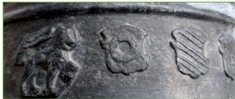
▲ Nel particolare si osservano il Leone di San Marco andante verso destra e gli stemmi dei tre Patroni dell'Arsenale in carica al momento della fabbricazione