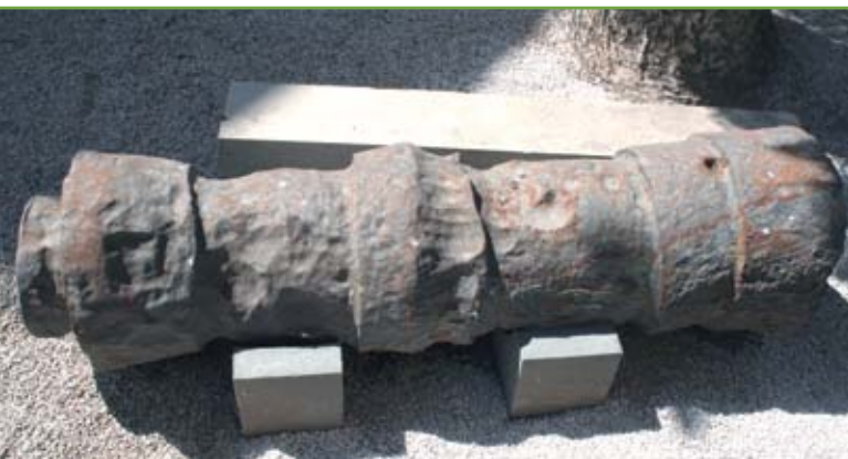
▲ 'Mascolo' di bombarda di ferro. Di grezza lavorazione e forse risalente all'inizio del XV secolo, si trova nel Museo Storico di Creta: l'isola fu veneziana dal XIII alla seconda metà del XVII secolo, circostanza che garantisce la sua origine

lizzava solo galee e galeazze – con un elevato numero di cannoni rese necessario ricorrere alle più economiche artiglierie di ferro.