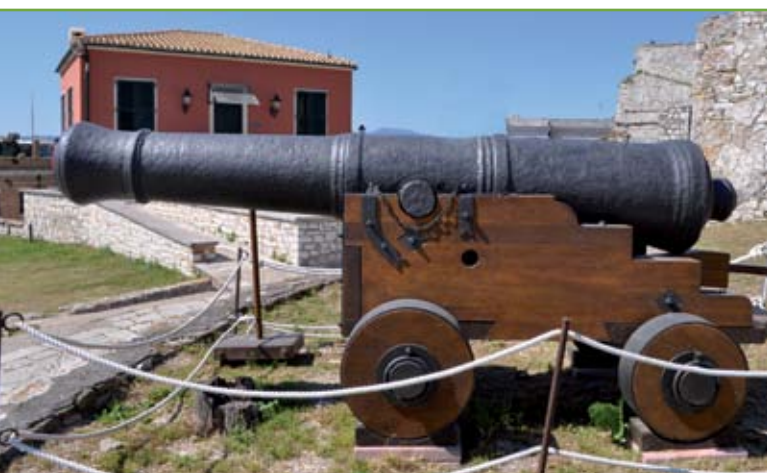
▲ Il secondo pezzo da 40 libbre incavalcato su un perfetto affusto 'alla navarola' realizzato sulla base di disegni coevi conservati nell'Archivio di Stato di Venezia

glierie di ferro prodotte in Inghilterra per la Repubblica; cannoni forse veneziani ma la cui certa origine, per le loro condizioni, non è certa.