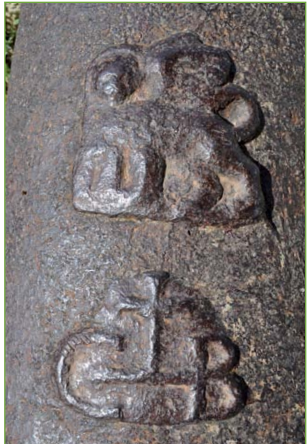
▲ Il Leone di San Marco andante con Vangelo aperto e l'inusuale monogramma del Camozzi inframmezzato da una Croce