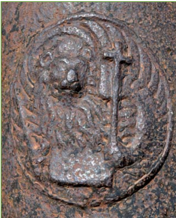
▲ Il Leone in moleca . Caratterizzato dal contorno tondo oppure ovale, presenta il solo busto con le ali arrotondate: è detto così perché ricorda un particolare granchio delle lagune venete ( Carcinus Aestuaris ) in fase di muta