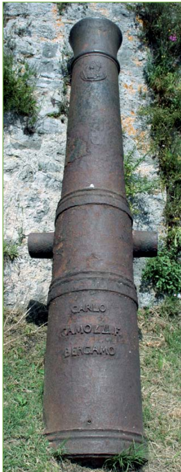
▲ Cannone da 40 libbre di Carlo Camozzi nell'interno della fortezza di Lefkada (Santa Maura): è uno dei molti sparsi nella fortezza, talvolta irraggiungibili per la folta vegetazione o per le precarie condizioni statiche della costruzione

Fondamentale per il successo fu l'impiego di ferro proveniente dalle valli bergamasche, Camonica e Scalve, ferro che veniva amalgamato con quello della Val Trompia: quest'ultimo, ottimo per la produzione di canne per armi portatili, come si è già accennato era risultato ina-