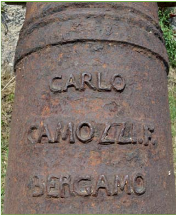
▲ Particolare della scritta in rilievo sul primo rinforzo. La fonderia del Camozzi era situata a Valle d'Almè di Clanezzo, in territorio già allora bergamasco