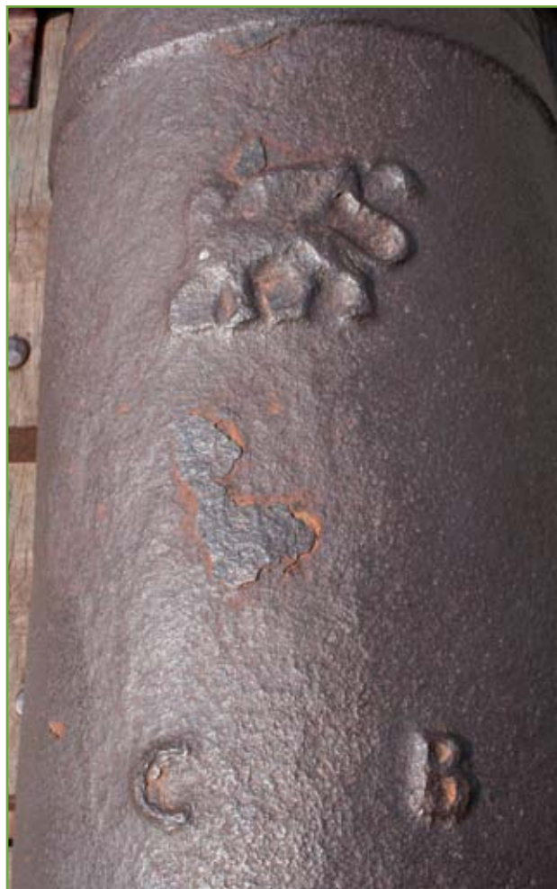
▲ Particolare del primo rinforzo con le iniziali C e B e un Leone di San Marco piuttosto grossolano

Questa ultima impresa, secondo i documenti d'archivio,