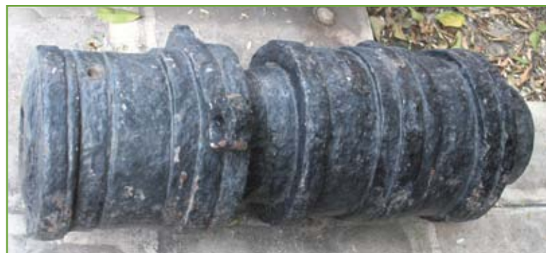
▲ 'Mascolo' di bombarda: anche questo pezzo di ferro, sempre conservato nel Museo Storico Nazionale di Atene, è di certa origine veneziana e risale alla seconda metà del XV secolo