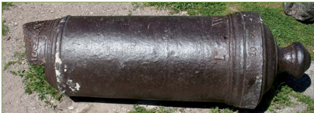
▲ Il frammento del cannone fuso da Thomas Western portato dalle truppe di Francesco Morosini nella fortezza di Acrocorinto