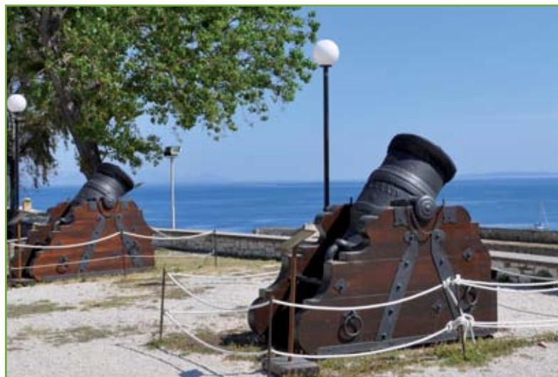
▲ I due mortai da 1.000 libbre restaurati e rimontati su nuovi affusti da Giovanni Leone, oggi sulla Piazza d'Armi della Fortezza Vecchia di Corfù

I pezzi, in ottime condizioni di conservazione, presentano le seguenti caratteristiche: entrambi hanno una lunghezza di 150 centimetri con un diametro alla bocca di 46,5 centimetri, mentre uno pesa 2.088 e l'altro 2.025 chilogrammi. Praticamente identici, ambedue presen-