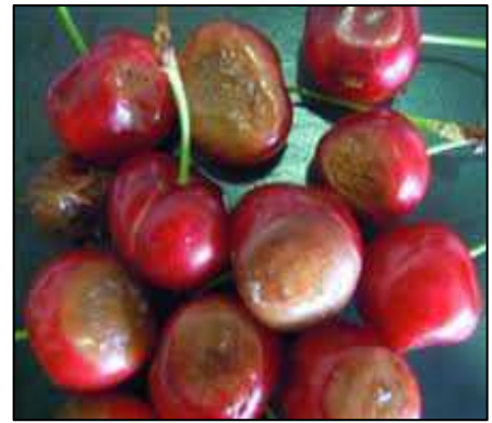
Figura 5: Danni da D. suzukii su frutti

Metodi di lotta alternativi alla lotta chimica quali catture massali con trappole ad aceto di mela, attract and kill e l'utilizzo di parassitoidi, non danno al momento risultati soddisfacenti, mentre i mezzi fisici quali le coperture con reti anti insetto possono funzionare ma sono di norma non praticabili.