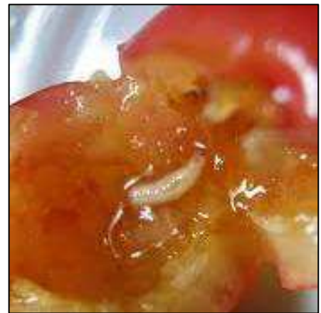
Figura 6: Larva di D. suzukii all'interno del frutto