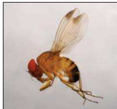
Figura 2: Adulto, evidenti le macchie sulle ali

Pupa: di color bruno, a maturità raggiunge una lunghezza di circa 3 mm. Su un apice sono visibili due peduncoli, sui quali sono inserite 7-8 piccole spine, la cui forma è simile a una stella. L'impupamento può avvenire sia internamente, che esternamente al frutto.