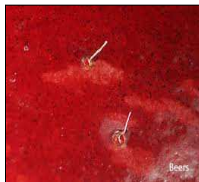
Figura 4: Filamenti bianchi Processi respiratori dell'embrione

La durata del ciclo è varabile in funzione delle condizioni climatiche (es. una generazione in 9 -11 gg a 25°C costanti).