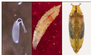
Figura 1: Uovo, larva e pupa

Uovo: di dimensioni ridotte (0.6-0.8 mm) e di colore bianco, ha forma ovale ed è provvisto di due filamenti bianchi necessari per il processo respiratorio dell'embrione. La femmina, mediante ovopositore dentato, depone in media 2-3 uova sotto l'epidermide del frutto, circa 400 durante il ciclo vitale.