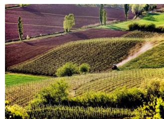
Vigneti a Meledo di Sarego Stefano Maruzzo Fotografia digitale - 2007