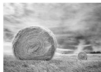
Balle di Fieno Nicola Tramarin Fotografia digitale - 2009