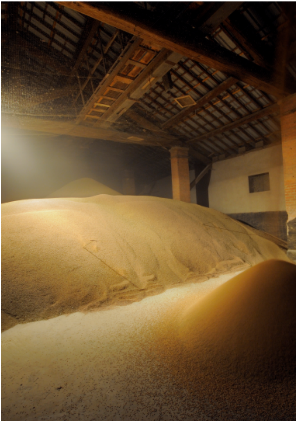
Filippo Rigon Italia, 1983 "Magazzino del riso" 2009 Fotografia digitale